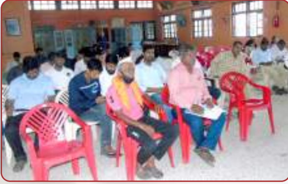
संस्थेच्या २१ व्या वार्षिक सर्वसाधारण सभेप्रसंगी सभेस उपस्थित सभासद वर्ग.