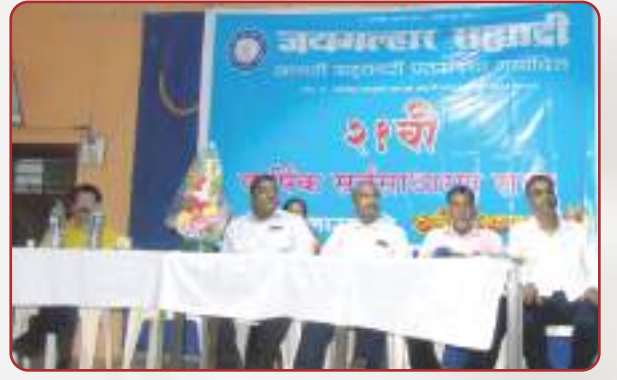
संस्थेच्या २१ व्या वार्षिक सर्वसाधारण सभेप्रसंगी सभेस उपस्थित संचालक मंडळ.