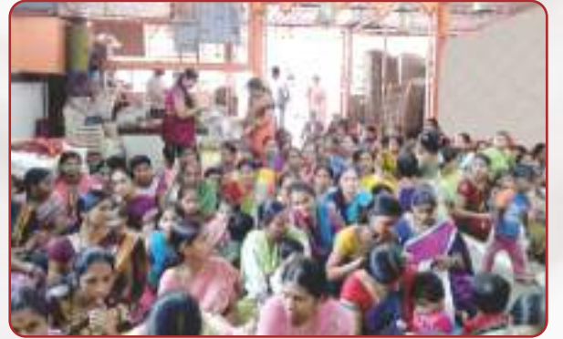
संस्थेच्या वतीने आयोजित हळदीकुंकू समारंभाप्रसंगी उपस्थित महिला वर्ग.