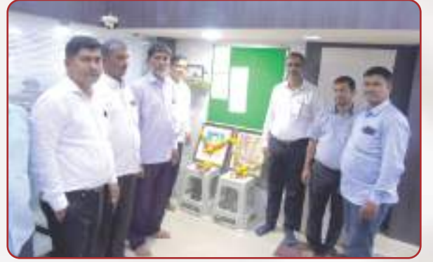
पुण्यश्लोक अहिल्याबाई होळकर यांच्या प्रतिमेस पुष्पहार अर्पण करून जयंती साजरी करताना संस्थेचे संस्थापक, संचालक, अधिकारी व कर्मचारी वृंद.