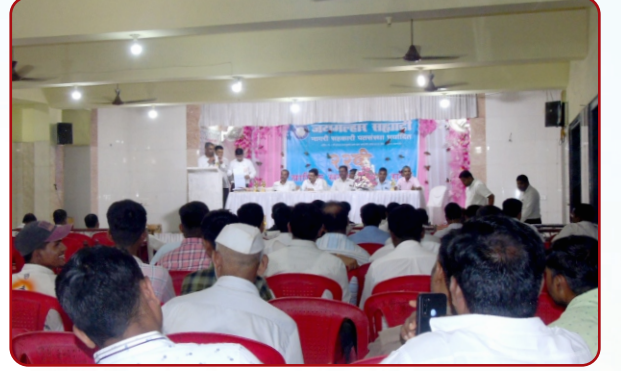
संस्थेच्या २२ व्या वार्षिक सर्वसाधारण सभेप्रसंगी उपस्थित सभासद.