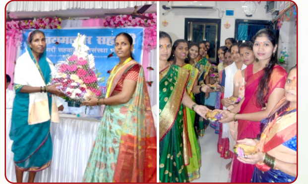
वार्षिक सर्वसाधारण सभेप्रसंगी उपस्थित महिला सभासदांचा सत्कार करताना संस्थेची महिला कर्मचारी. संस्थेच्या वतीने आयोजित हळदीकुक्कू समारंभाप्रसंगी उपस्थित महिला वर्ग.